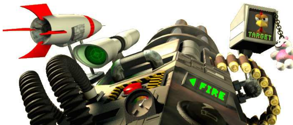
Die Superwaffe: LUCIEE SKYCLEANER PRO

Im rechten Teil kurz vor dem Eingang der Farm steht der, schon in einer frühen Ankündigung genannte, Zauberbaum. Wenn man genau hinsieht, erkennt man auch ein düster drein blickendes Gesicht. Wenn Du auf den Baum schießt wird Dir pro Schuss 1 Punkt abgezogen, passieren tut nichts.